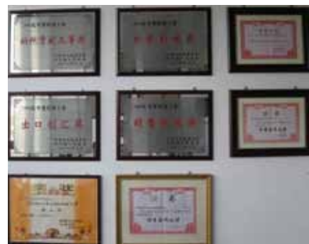
Steni v Iskri Suzhou, ki jo že krasi mnogo priznanj, se bo odslej pridružilo še eno