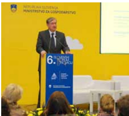
Predsednik Republike Slovenije Danilo Türk